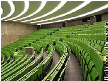
Der Hochschulpakt, die Exzellenzinitiative und der Pakt für Forschung und

Innovation wurden nach langem Hin und Her unterzeichnet. Das begrüßen wir im Grundsatz. Allerdings ist die Finanzierung völlig unsicher. Woher die Milliarden kommen sollen, verschweigt die Regierung.